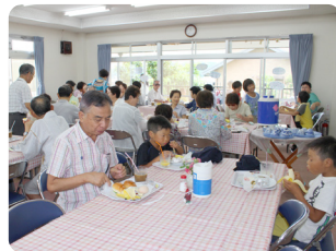
世代間交流サロンの様子