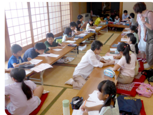
夏休み子ども教室