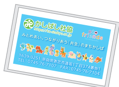
ポケットティッシュ