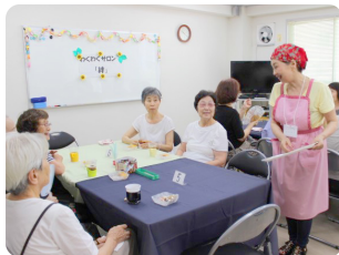
サロンでの楽しいひととき