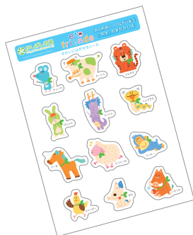
えとフレンズキャラシール