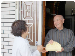
ふれあい食事サービス